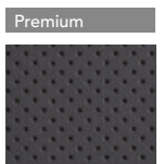
Simil Cuero Negro