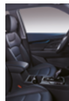
Interior negro y azul