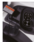
Conector de carga tipo 2 (Mennekes) y conector CCS