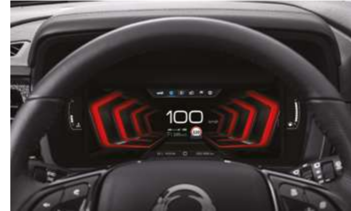
Cuadro de instrumentos digital TFT de 26,03 cm (10,24")