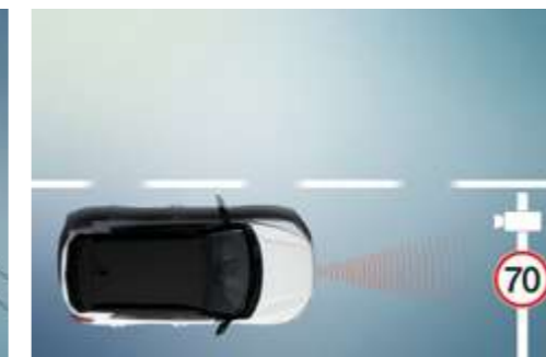
Sistema de reconocimiento de señales de tráfico (TSR)

Ayuda a evitar o minimizar el riesgo de colisión detectando vehículos que circulan más despacio o están parados y avisando al conductor con antelación.