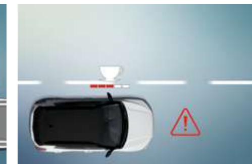
Sistema de advertencia de fatiga (DAA)

El SDA calcula la distancia con el vehículo de delante y avisa al conductor cuando no se mantiene la distancia de seguridad.