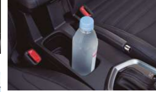
Consola central con dos portavasos