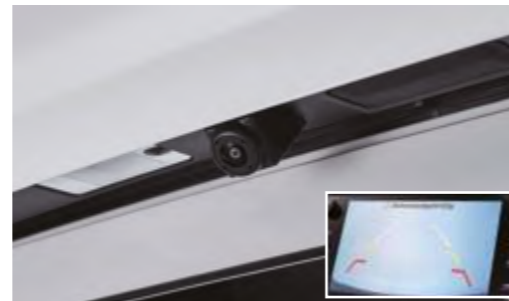
Cámara de visión trasera