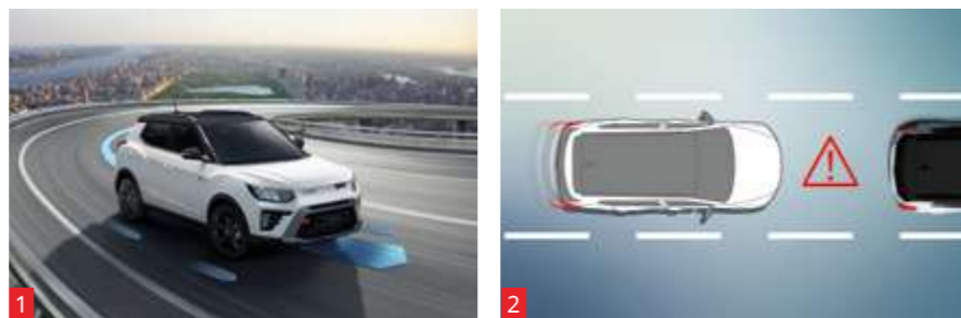
1 Sistema activo antivuelco (ARP) 2 Aviso luminoso de frenada de emergencia (ESS) 3 Control de descenso en pendientes (HDC) 4 Asistente de arranque en pendientes (HSA)