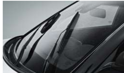
Sensores de encendido automático de limpiaparabrisas