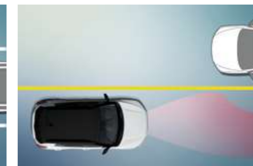
Sistema de antideslumbramiento automático (HBA)

Alerta al conductor cuando otro vehículo o peatón aparece en la trayectoria del vehículo.