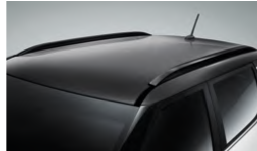
Rieles de techo