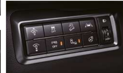
Consola de conmutación múltiple