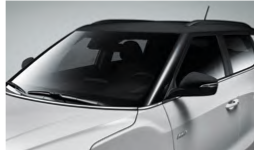
Molduras cromadas en línea de cintura y capó