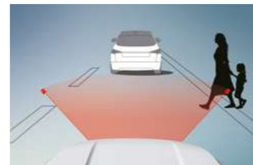
Sistema avanzado de frenada de emergencia (AEBS)

Ayuda a evitar o minimizar el riesgo de colisión detectando vehículos que circulan más despacio o están parados y avisando al conductor con antelación.