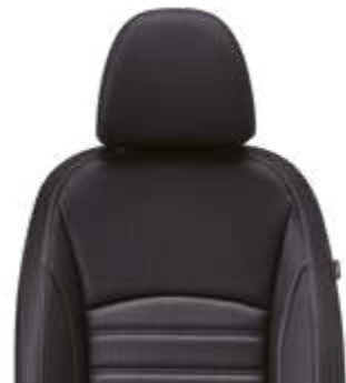
Tapicería mixta (tela y símil cuero)