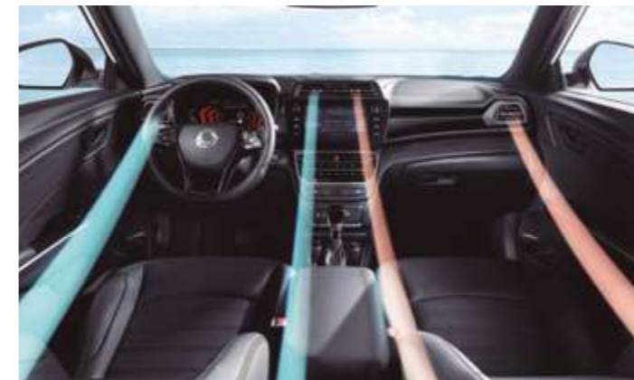
Climatizador automático bizona