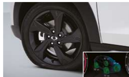
Sistema de control de presión de los neumáticos (TPMS)