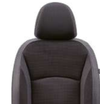
Tapicería de tela negra