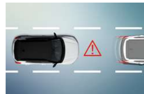
Sistema de aviso de avance del vehículo delantero (FVSA)

Cuando el sistema DAA detecta que el nivel de atención del conductor se ha reducido significativamente, emite una advertencia sonora y muestra una imagen en el panel de instrumentos.