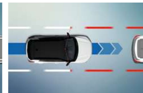
Sistema de permanencia en carril (LKAS) Sistema de advertencia de salida de carril (LDWS)

Cuando el vehículo está detenido y el que está situado justo delante empieza a avanzar, el FVSA emite una alerta visual y otra sonora.