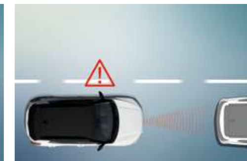
Sistema de alerta de distancia de seguridad (SDA)

Reconoce las señales de tráfico y transmite al conductor la información que aparece en ellas a través del panel de instrumentos.