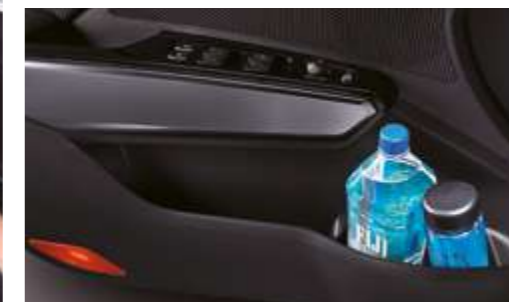
Espacio de almacenaje en las puertas