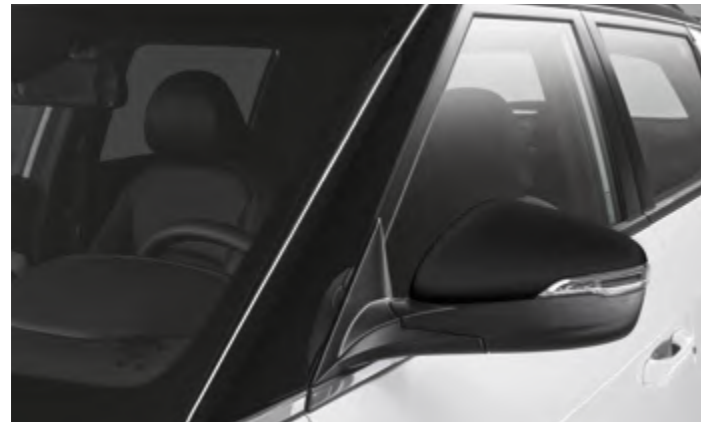
Acabado negro brillante en el pilar A