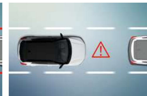
Sistema de alerta de colisión frontal (FCW)

Estos sistemas utilizan una cámara frontal para controlar las líneas de delimitación de carril pintadas. Al detectar un intento de cambio de carril sin señalización previa, el LDWS alerta al conductor y el LKAS corrige automáticamente la dirección para mantener el vehículo dentro del carril.