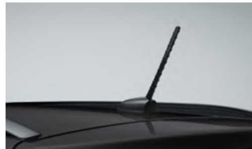
Antena de poste montada en el techo