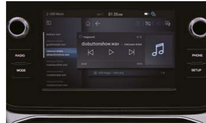
Sistema de infoentretenimiento con navegador de 22,86 cm (9")