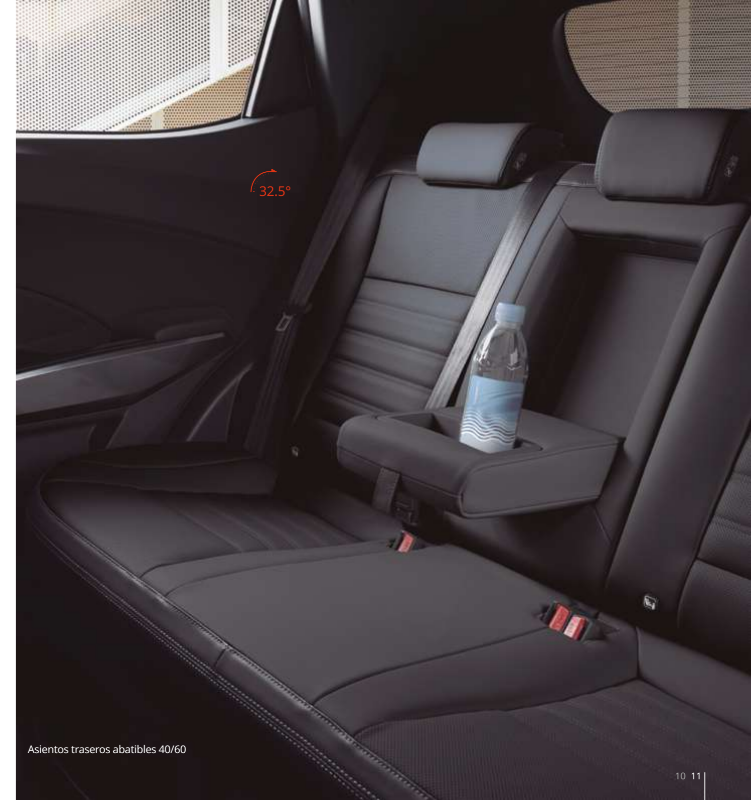
Asientos traseros abatibles 40/60

El resultado es un habitáculo moderno, lujoso y sorprendentemente espacioso, con un nivel de detalles que realza una calidad percibida única en su categoría. El Tívoli ofrece soluciones adaptadas a las necesidades actuales, como un alojamiento específico para tablets, guantera con espacio para un ordenador portátil y porta-botellas en todas sus puertas.