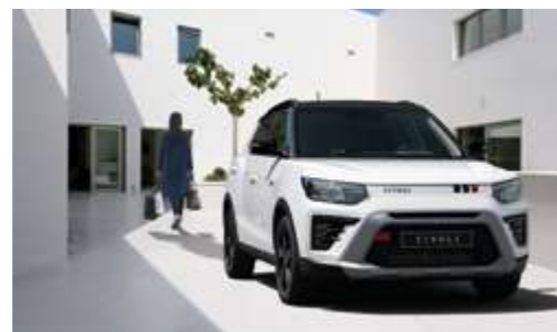
Sistema de acceso y arranque sin llave