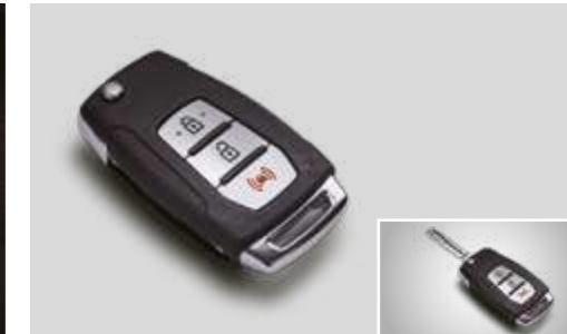
Llave plegable con mando a distancia