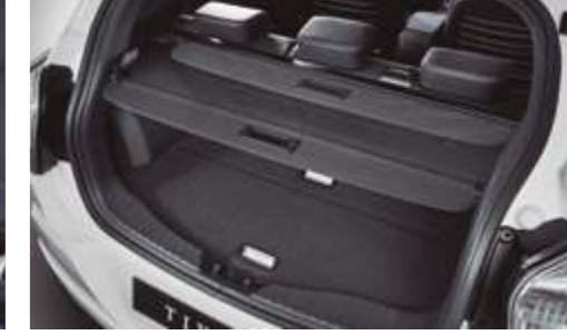
Estor cubre equipajes