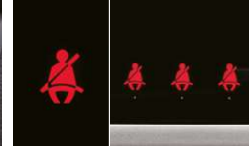
Aviso de cinturones de seguridad en todas las plazas