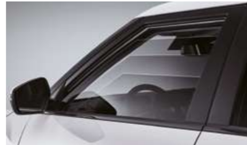
Ventanas eléctricas (delanteras de un sólo toque)