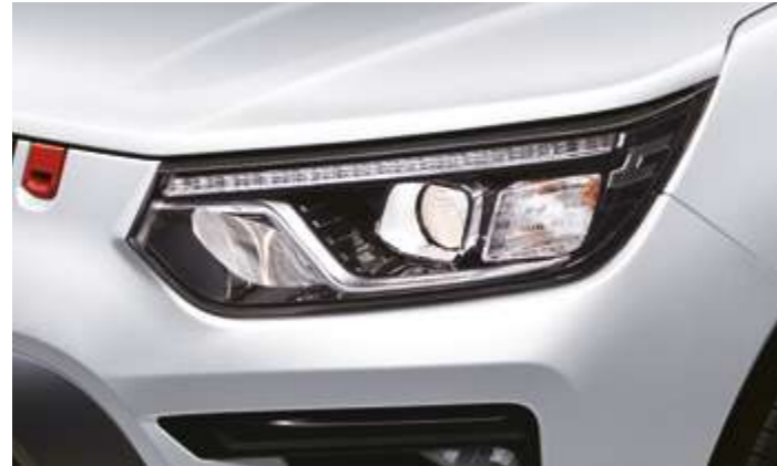
Faros de proyección con luces diurnas LED

PREPÁRATE PARA DISFRUTAR Y HAZLO CON ESTILO