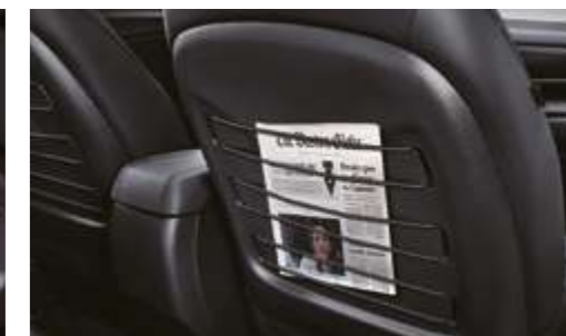
Soporte con cuerda elástica en los respaldos de los asientos delanteros